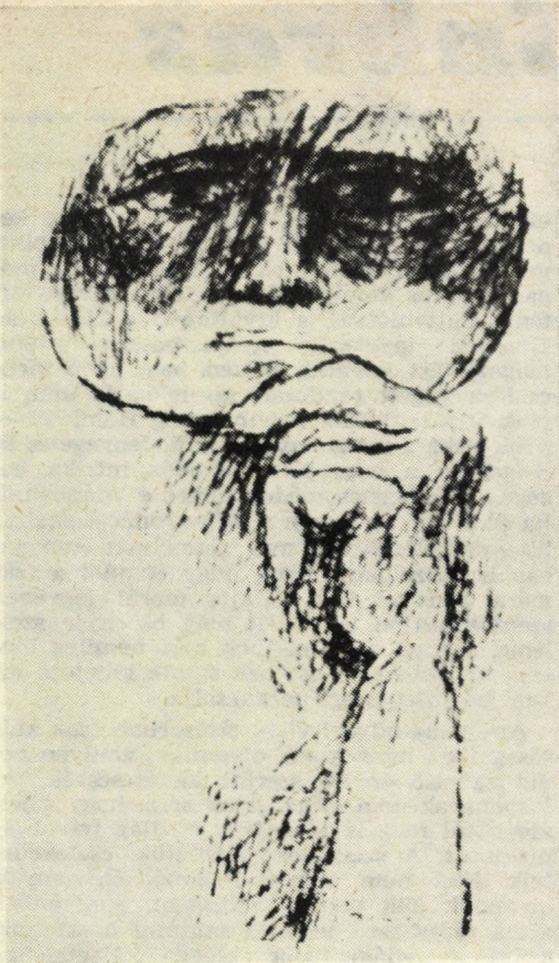
Graham Coughtry rajza